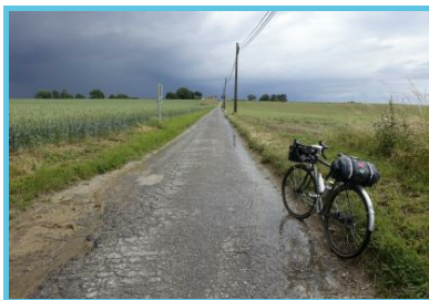
WBT – Hike Up/Railtrip.Travel