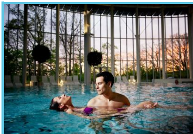
Thermes de Spa - Fabrice Debatty