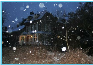
Projet - NOW