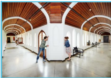
WBT - Denis Erroyaux