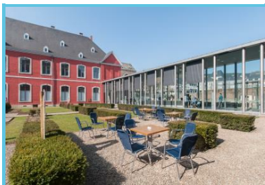
WBT - JP Remy