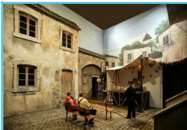
FT Province de Namur