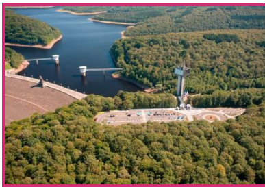
Barrage du lac de la Gileppe