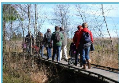
Parc naturel HF-E ASBL